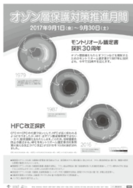
2017年度オゾン層保護 対策推進月間ポスター

日本では、9月を「オゾン層保護対策推進月間」として、毎年、オゾン層保護やフロン等対策に関する様々な普及啓発活動を行っています。