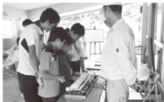
▲フロンがどうやって冷えるかを体験

毎年参加しているこのキャンプでは、子どもたちにフロンガスとはどんなものなのかをパネル展示や回収作業の実演を見せたり、機器等に実際に触れることを通じて分かりやすく説明し、フロンガスの大気への放出が、オゾン層破壊や地球温暖化にいかに関与しているかを学習してもらいました。