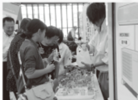
▲ご家族でアンケートに答える来場者