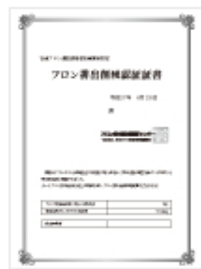
フロン排出削減認証証書