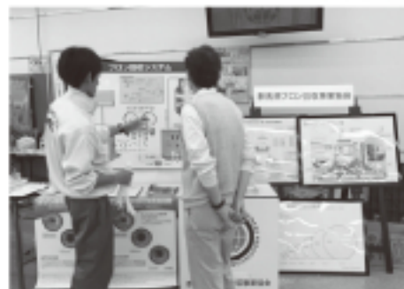
▲回収システムのパネルについて質問をうける

多くの皆様に地球環境とフロンについて知ってもらうよい機会として、毎年出展しています。電飾パネル等による説明やアンケートへの協力にお声がけする事で、協会の活動やフロンが関係するオゾン層破壊・地球温暖化について興味を持っていただき、ご質問もたくさん受けました。今年も大勢の来場者があり、たくさんの方にフロンについて知ってもらう事ができ、よいPR活動になったと思います。