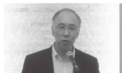
▲西園先生のご講演