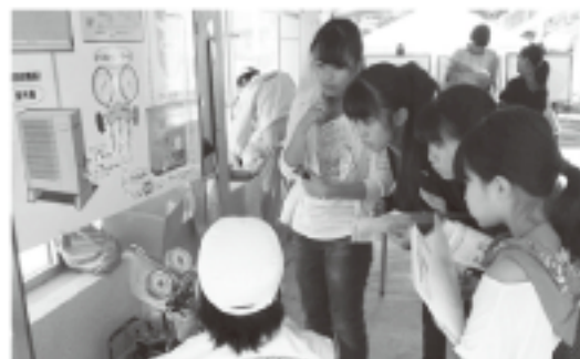
▲フロン回収についてパネルを使って説明