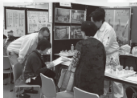
▲アンケートに答えてもらい感謝について話す